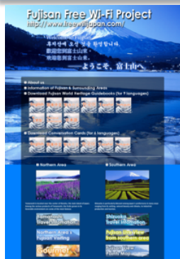
ポータルサイトイメージ

富士山周辺を訪れる 外国人観光客の観光利便性向上、安心安全な旅のサポート等、滞在現地における行動支援を目的に共通ポータルサイト「Fujisan Free Wi-Fi Project Official Website」（英、中、韓）を開設 します。